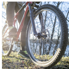
Llantas de bicicletas