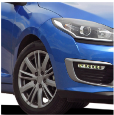
Llantas de automóviles