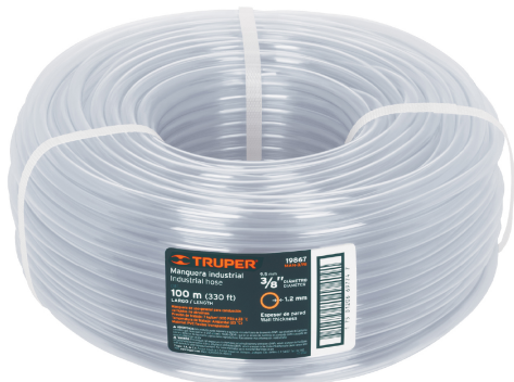
Rollo de manguera 100 m